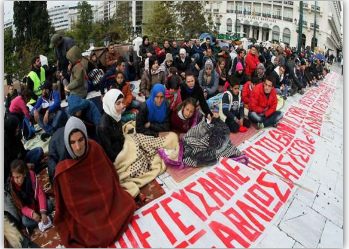
Σύριοι πρόσφυγες στην Ελλάδα 2016