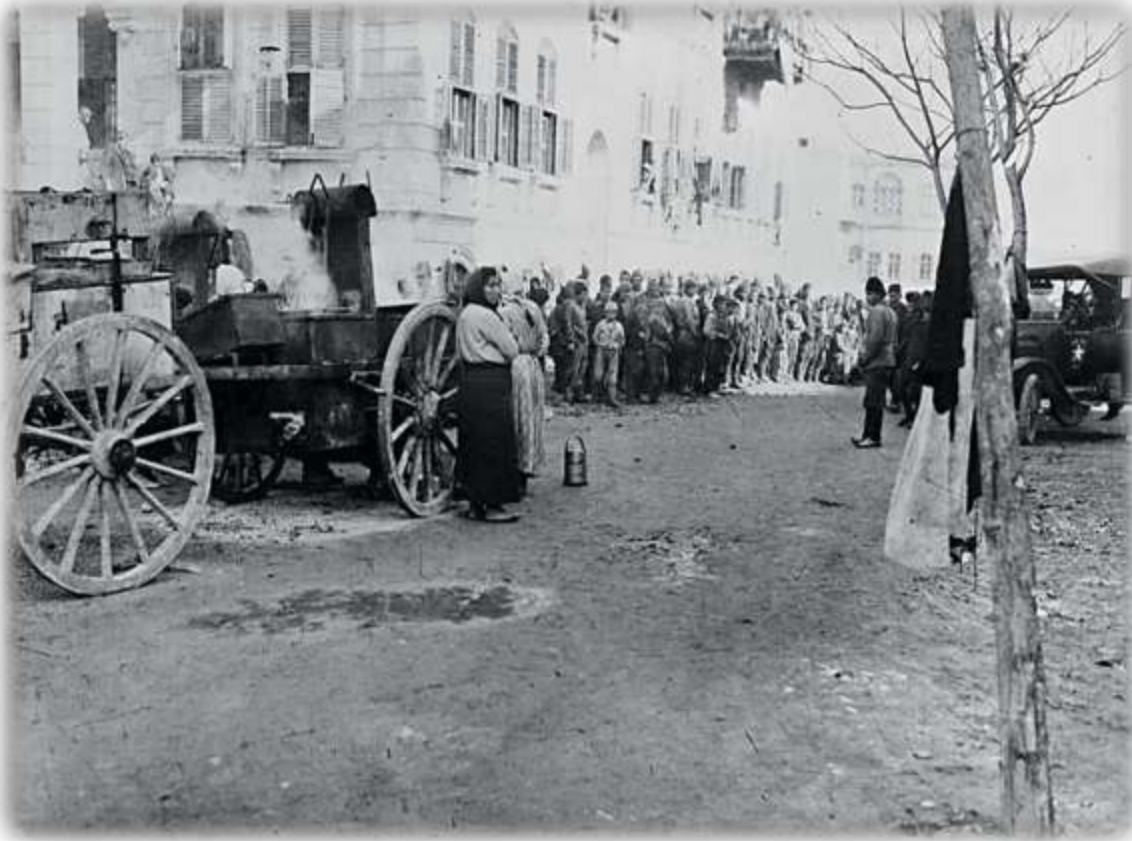
Έλληνες πρόσφυγες στο Χαλέπι της Συρίας 1923